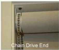
Chain Drive End

For large width blinds, have a second person help hold the blind into position. This eliminates the risk of dropping & damaging the blind.