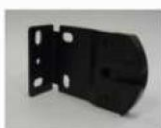
Στήριγμα Μηχανισμού Chain Drive Bracket

The Chain drive bracket goes to the side that has the operating chain.