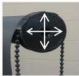
Position end cap correctly